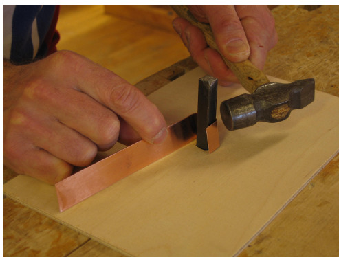
Bocka med hammare el. för hand.

För att få vinkelräta bockningar kan man göra följande: Borra ett runt hål i ett skivmaterial som filas till en kvadrat. Placera ett fyrkantstål där i som spänns fast i bänken på undersidan.