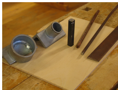
Olika former att bocka runt.